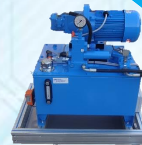
Centrale hydraulique débit fixe ou variable UAH 110 - UAH 130