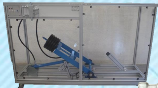
Basculeur UAH 930