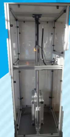
Vérin lève charge UAH 920