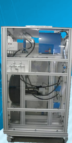
Module endurance de pneu UAH 970