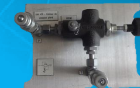
Limiteur de pression pilote à pilotage externe UAH 420