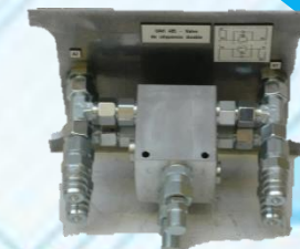
Valve de séquence double UAH 485