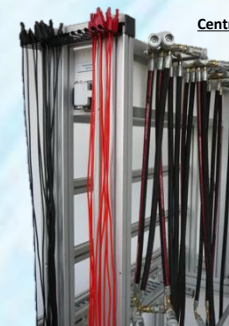
Lots de cordons UAH 210