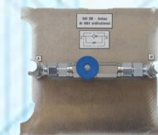
Limiteur de débit unidirectionnel UAH 560