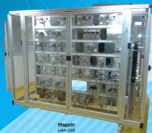
Magasin UAH 030