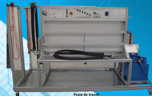
Poste de travail UAH 012

Reproduction interdite Copyright DIDATEC 2015 Photos non contractuelles V.2015.12