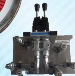
Vanne pilote UAH 087 D