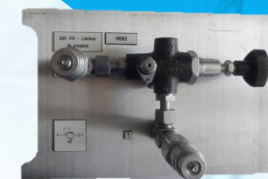
Limiteur de pression UAH 410