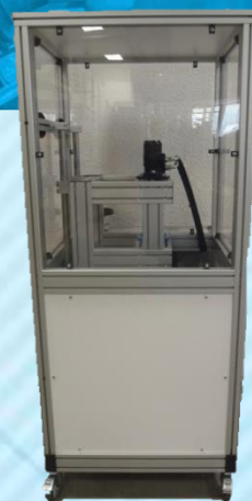
Malaxeur UAH 940